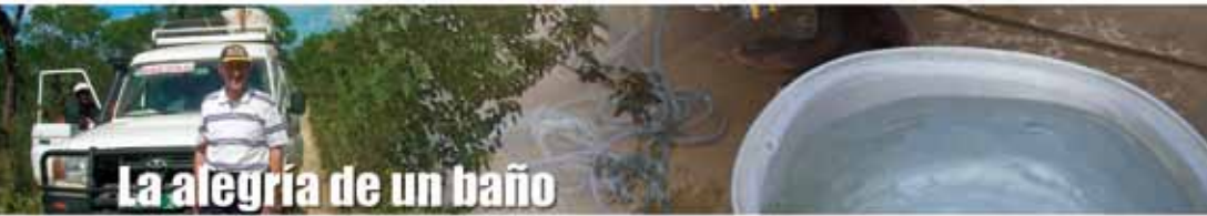
La alegría de un baño

Después de un almuerzo, llegó un niño simpático pero todo sucio (es bastante normal ver críos sucios y con ropas zarrapastrosas en estas comunidades rurales). Pregunté si no quería tomar un baño, mostrándole un balde de agua que estaba allá, fuera de casa, preparado para nuestra acogida. Vi que su respuesta era de alegría y... ¡entró en el agua con camisa y calzón! Luego le quité la ropa. Llegó su hermanita y le di una pastilla de jabón perfumado para lavarle. No pueden imaginar su felicidad, la de sus amiguitos y la de las madres, viendo aquella escena tan inocente.