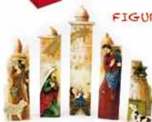
NACIMIENTO GRANDE DE 5 PIEZAS Alto: 26cm • Ancho: 25cm • Fondo: 3,5cm