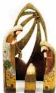
NACIMIENTO PEQUEÑO DE 4 PIEZAS Alto: 20,5cm • Ancho: 10cm • Fondo: 4cm