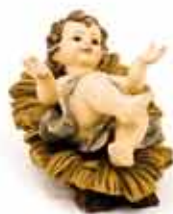
NIÑO PEQUEÑO Ancho: 7,5cm • Largo: 11cm