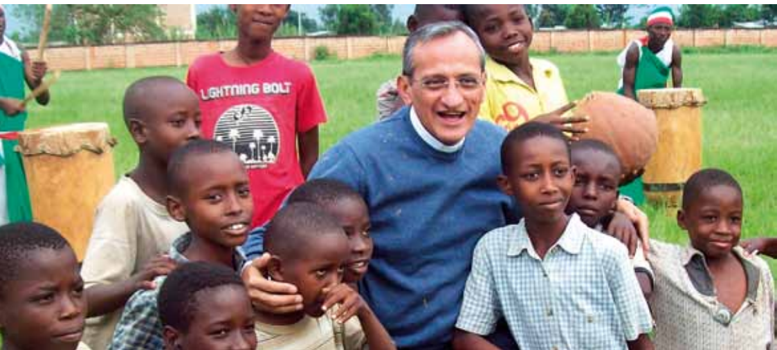
D. PASCUAL CHÁVEZ, CON NIÑOS DE BURUNDI

Además, animó a los jóvenes "a soñar con un futuro mejor para su país y a cultivar las herramientas para hacer que sus sueños se hagan realidad, como se esforzó Don Bosco". Los misioneros salesianos trabajan en Burundi con los niños y jóvenes más desfavorecidos en las misiones de Ngozi, Rukago y Bujumbura, la capital. Escuelas, centros juveniles y un centro para niños de la calle son las obras más representativas. En las celebraciones, también estuvieron presentes la Vicepresidenta del Senado, varios ministros, embajadores y Monseñor Banshimiyubusa, que agradeció a los misioneros los avances conseguidos en estos 50 años de duro e incansable trabajo. ■