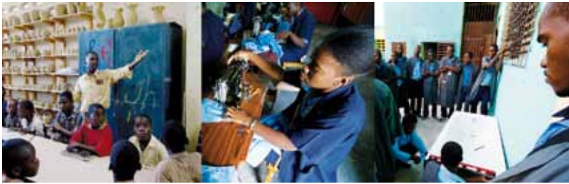
DIFERENTES TALLERES QUE SE IMPARTEN EN ENAM