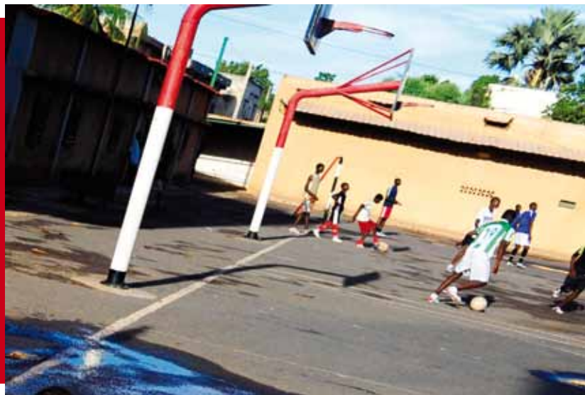
EN LA TARDE EL PATIO SE LLENA DE NIÑOS QUE QUIEREN JUGAR