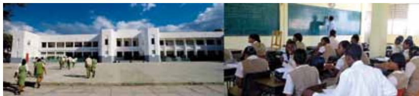
ENAM ANTES DEL TERREMOTO DE 2010 (EXTERIOR / INTERIOR)

En el proceso de reconstrucción de las obras salesianas, una etapa de gran importancia era la reedificación de la gran estructura salesiana en Haití, la Escuela Nacional de Artes y Oficios" (ENAM), la primera comunidad abierta por los Salesianos en el país, en 1935, situada en el barrio La Saline. La reapertura, mediante una solemne ceremonia tuvo lugar el pasado 21 de diciembre.