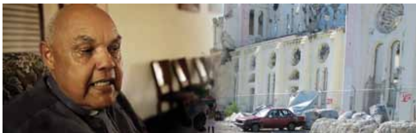
MONSEÑOR KÉBRAU Y LA CATEDRAL DE PUERTO PRÍNCIPE TRAS EL TERREMOTO DE 2010.

El Arzobispo de Cap Haitien (Haití), Louis Kébrau, pasó por Madrid y aprovechamos para hablar con él y conocer de primera mano cómo va la reconstrucción de Haití.