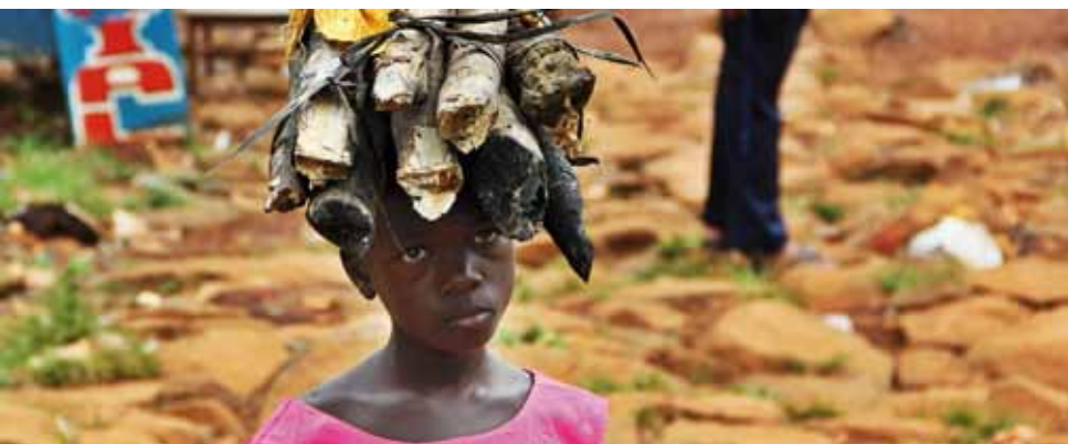
NIÑA PORTANDO LEÑA EN SU CABEZA, UN TRABAJO HABITUAL.

En enero de 2008, el Ministerio de la Familia y la Infancia, junto con la Oficina Internacional de Trabajo de Benín y la Asociación Beninesa de Asistencia a la Infancia y a la Familia, presentaron un Plan Nacional de Lucha Contra la Trata de Niños.