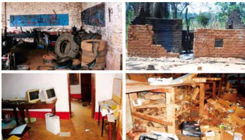
SAQUEOS EN LAS CASAS.