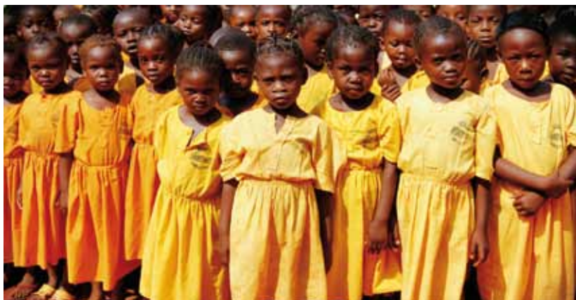
NIÑAS DE UNA ESCUELA DE BANGUI.

En las guerras, la población civil, desprotegida, es la más afectada. Los misioneros salesianos permanecen a su lado, sobre todo, de los niños, niñas y jóvenes víctimas inocentes de la violencia a su alrededor. Y cuando el conflicto armado finalice, los misioneros permanecerán para ayudar a superar el horror vivido y trabajar por la paz. ■