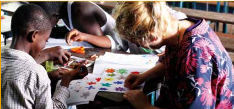
VOLUNTARIA REALIZANDO ACTIVIDADES CREATIVAS CON NIÑOS DE SIERRA LEONA.

Es una gran ironía, pero a veces el ser humano, para valorar la felicidad, necesita sentir la tristeza, para valorar la presencia necesita sentir la ausencia... Por ello, si tengo el honor de participar en esta gran experiencia, propondría a mi vuelta hacer todo un ejercicio práctico donde se vea la importancia de cada uno de los grandes valores que la otra realidad nos aporta para ser mejores personas y para luchar juntos por un objetivo común. La felicidad de todos. ■