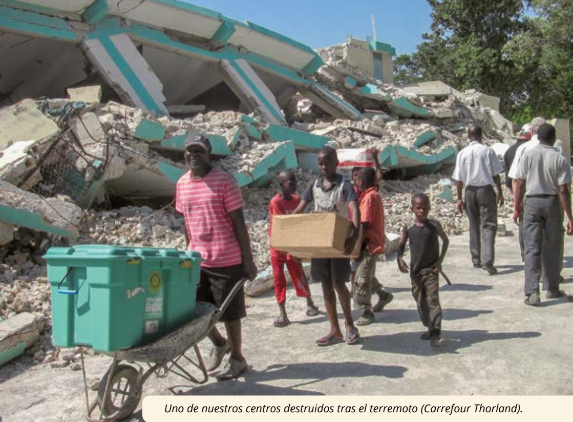
Uno de nuestros centros destruidos tras el terremoto (Carrefour Thorland).